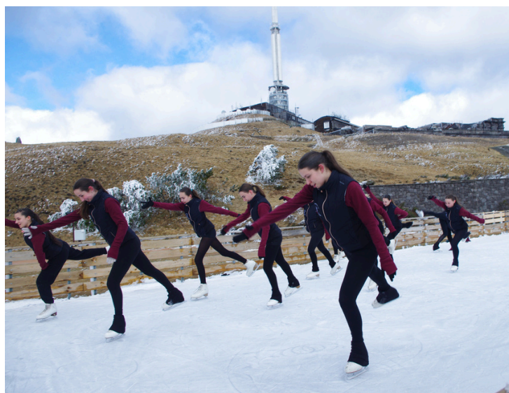
Représentation des Eruptives au sommet du Puy-de-dôme, Février 2025